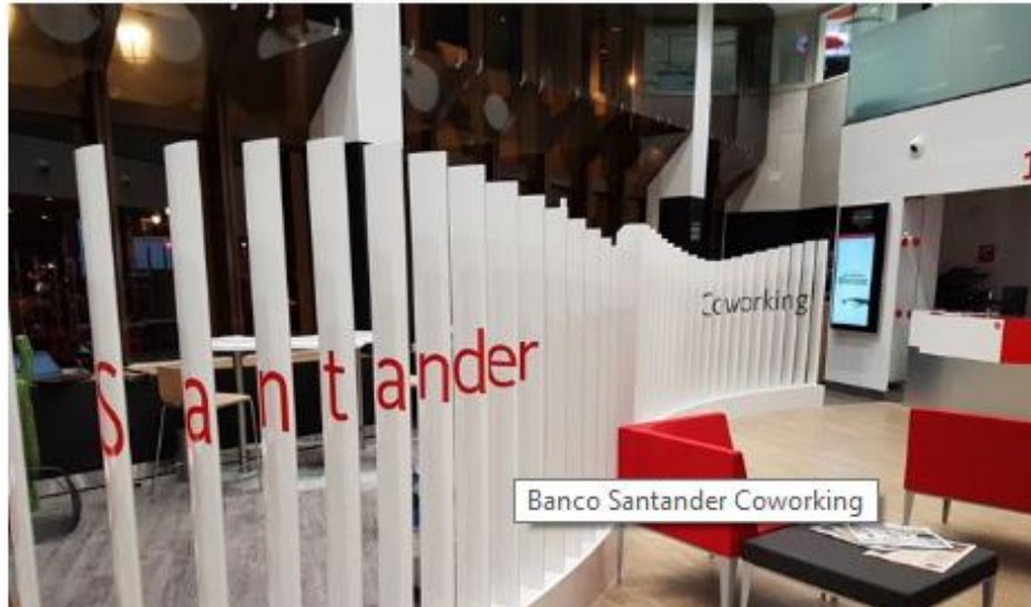
Banco Santander Coworking